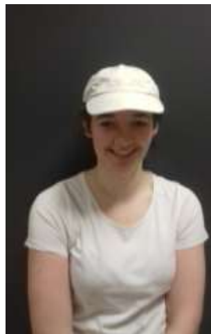
1 ère Place